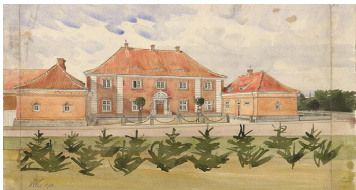
Akvarel af Hack Kampmann