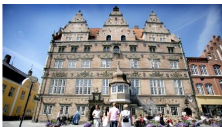
Jens Bangs Stenhus

Om morgenen søndag, den 25. maj, drog 37 personer af sted i bus til Aalborg. Det var Museumsforeningen og FBL's fælles årlige sommerudflugt, der i år gik til regionens store by.