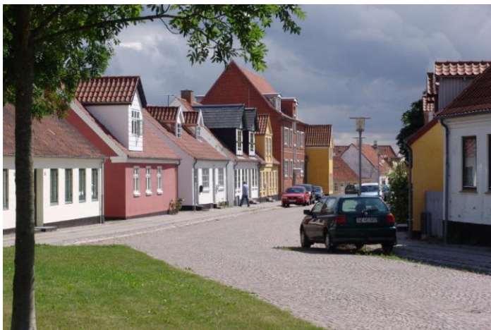
Nørre Allé, Hjørring

kiv og kommunen om mulighederne for at få projektet i gang.