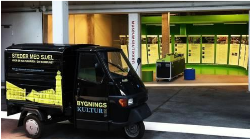
Udstillingen omfatter også en kulturarvscruiser – plancher i baggrunden.

Det er Bygningskultur 2015, en indsats for bygningskulturarven i et samarbejde mellem Kulturstyrelsen og Realdania, der tilbyder udstillingen til kommunerne.