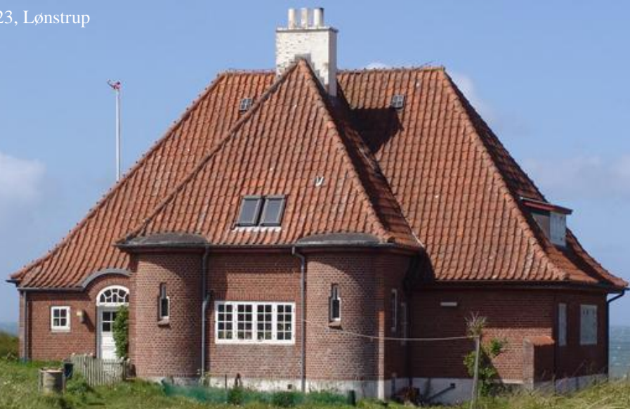
Sundet 23, Lønstrup

En bygnings bevaringsværdi fastlægges ud fra nogle kriterier, der præsenteres på de følgende sider. Der kan ikke altid skelnes skarpt mellem dem; ofte vil de overlappe hinanden.