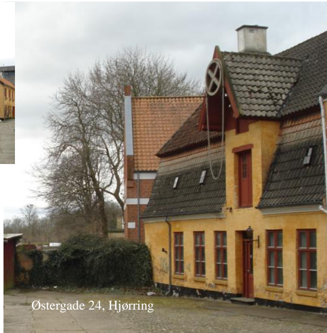
Østergade 24, Hjørring

Her findes endnu et par karakteristiske hejseværker til tagetagens lagerrum.