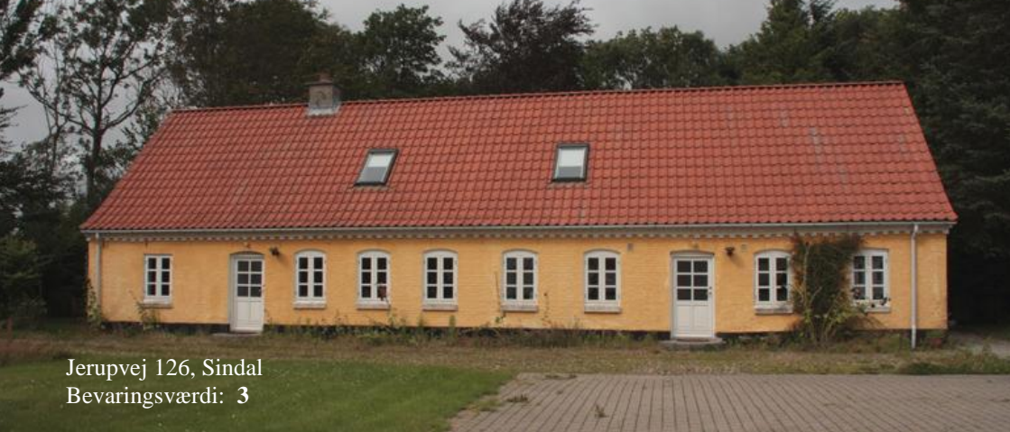
Jerupvej 126, Sindal Bevaringsværdi: 3