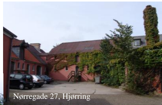
Nørregade 27, Hjørring

Nørre Torv og Nørregade i Hjørring har såvel i gadens facader som i baggårdens rum en stor sammenhængskraft, hvor de enkelte bygninger er med til at skabe et godt og hyggeligt miljø at opholde sig i.