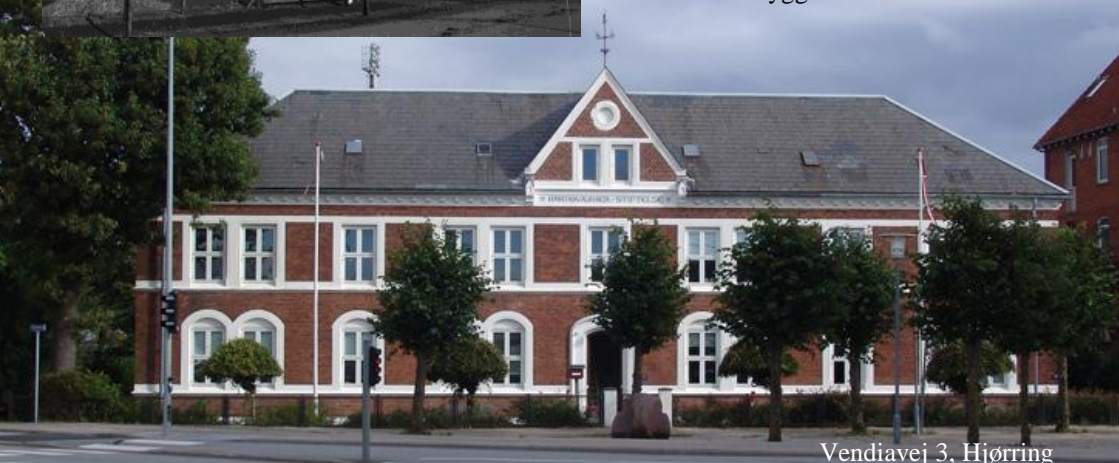
Vendiavej 3, Hjørring

”Håndværkerstiftelsen” på Vendiavej 3 i Hjørring fremtræder i dag stort set, som da den blev bygget i 1891.