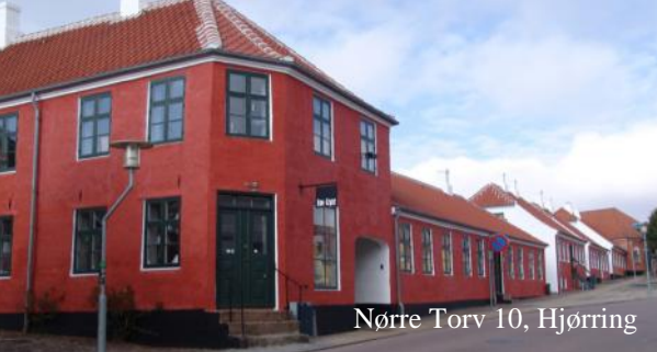
Nørre Torv 10, Hjørring