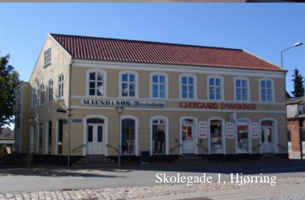
Skolegade 1, Hjørring