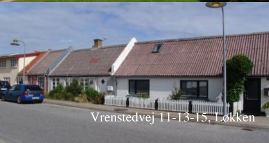
Vrenstedvej 11-13-15, Løkken