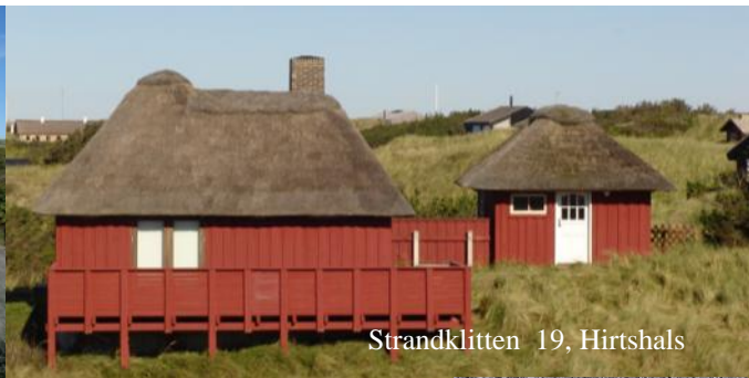
Strandklitten 19, Hirtshals