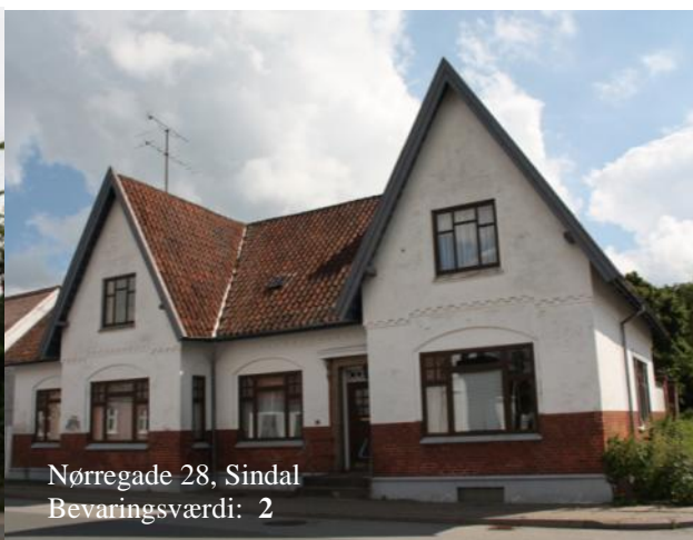
Nørregade 28, Sindal Bevaringsværdi: 2