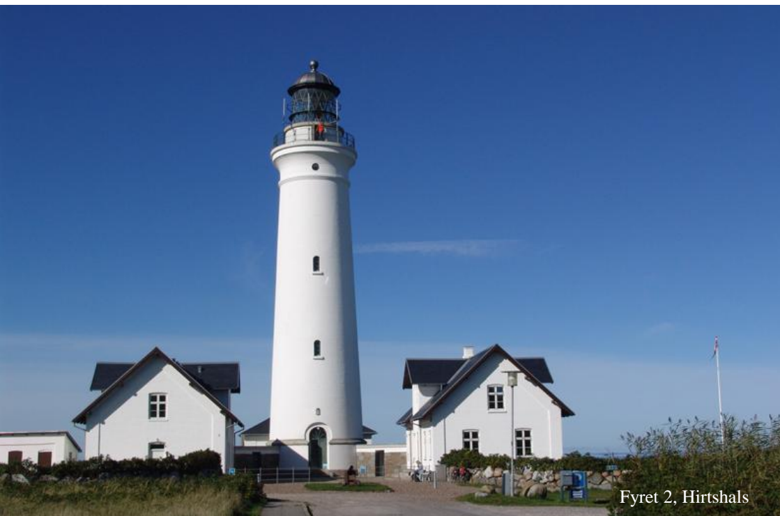
Fyret 2, Hirtshals

Slots- og Kulturstyrelsen: http://slks.dk/