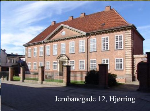
Jernbanegade 12, Hjørring