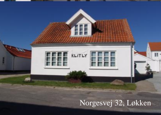
Norgesvej 32, Løkken