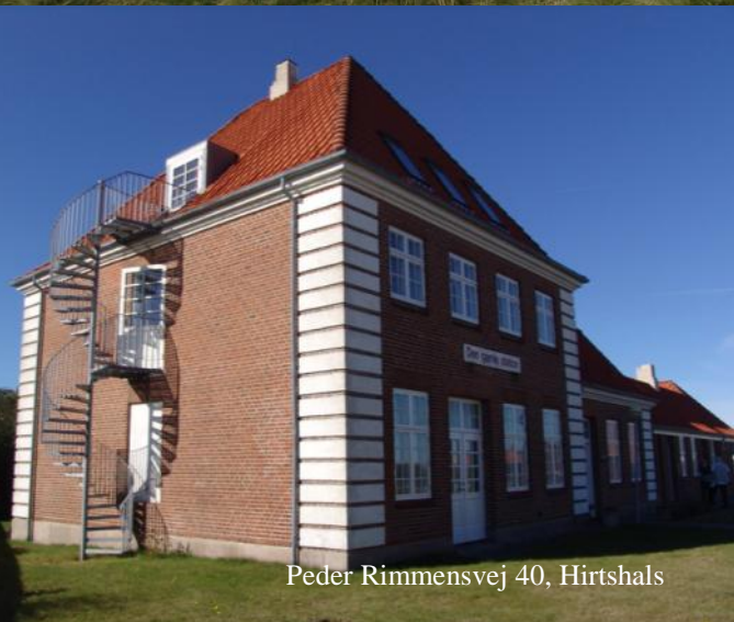
Peder Rimmensvej 40, Hirtshals