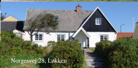
Norgesvej 28, Løkken