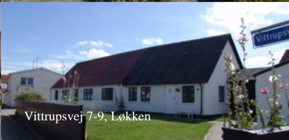
Vittrupsvvej 7-9, Løkken