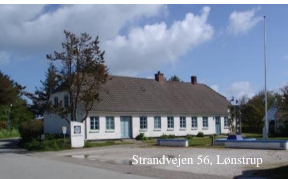
Strandvejen 56, Lønstrup

Her befinder stort set alle udpegninger sig enten i Lønstrup eller inden for cityringen i Hjørring by med langt størstedelen i Gl. Hjørring.