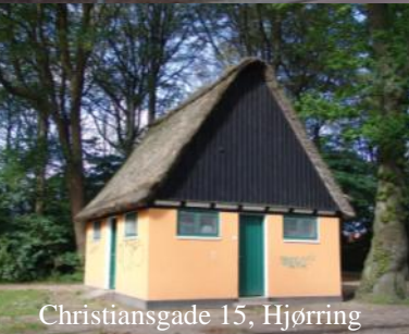
Christiansgade 15, Hjørring