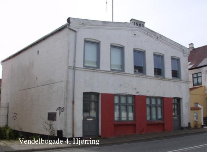
Vendelbogade 4, Hjørring

Vendelbogade 4 i Hjørring synes ikke af meget, men huset gemmer på en helt særlig historie.