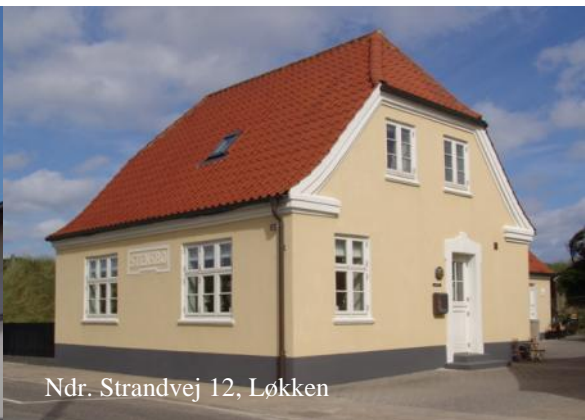
Ndr. Strandvej 12, Løkken