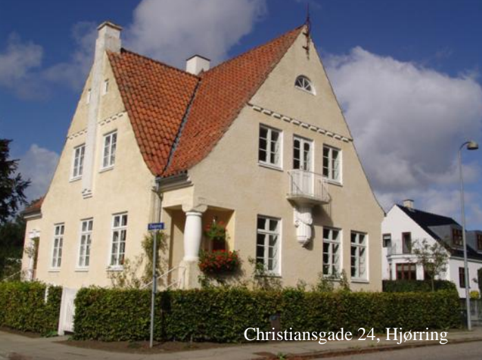
Christiansgade 24, Hjørring