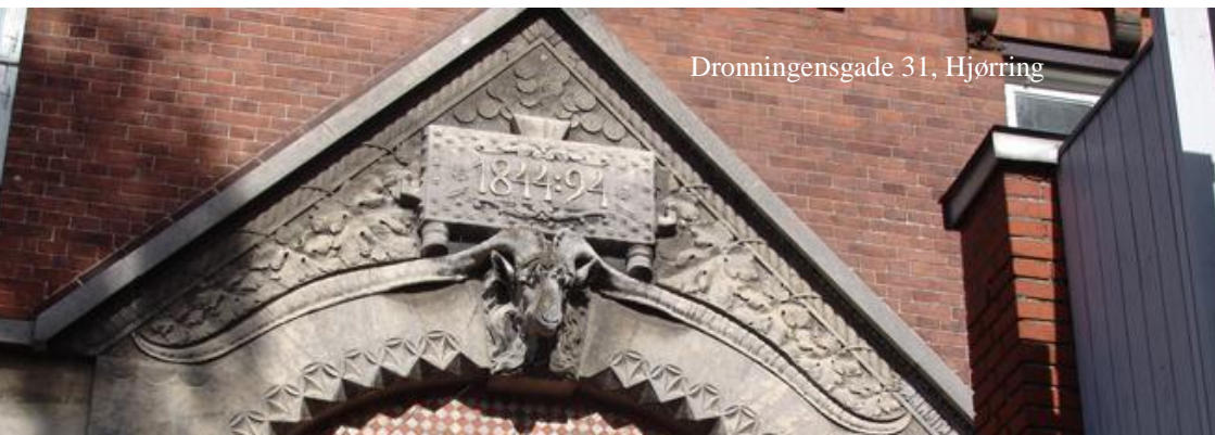
Dronningensgade 31, Hjørring

Hæftet skal gerne medvirke til at skabe opmærksomhed omkring de bevaringsværdige huse, så ejerne passer godt på dem, og Hjørring Kommune finder frem til de bygninger, der fortjener udpegning som bevaringsværdige. Der mangler nemlig stadig en del.