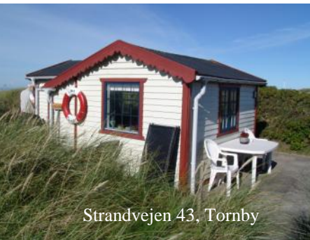
Strandvejen 43, Tornby

Her er der kun foretaget ganske få udpegninger dels i Hirtshals by og dels ved Tornby Strand og i Ingeborg Klit.