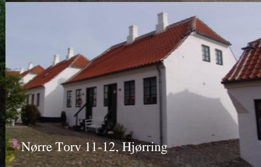
Nørre Torv 11-12, Hjørring