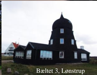
Bæltet 3, Lønstrup