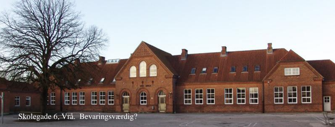
Skolegade 6, Vrå. Bevaringsværdig?