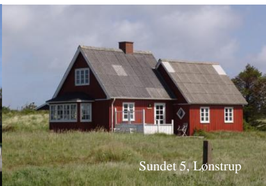
Sundet 5, Lønstrup