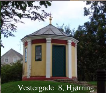
Vestergade 8, Hjørring