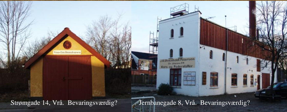
Strømgade 14, Vrå. Bevaringsværdig?