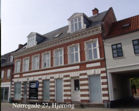
Nørregade 27, Hjørring