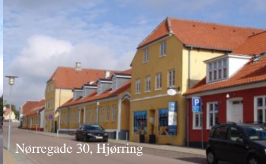
Nørregade 30, Hjørring