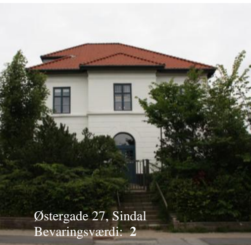
Østergade 27, Sindal Bevaringsværdi: 2

Det er kun bygninger med karaktererne 1-3, der af Hjørring Kommune bliver udpeget som bevaringsværdige.