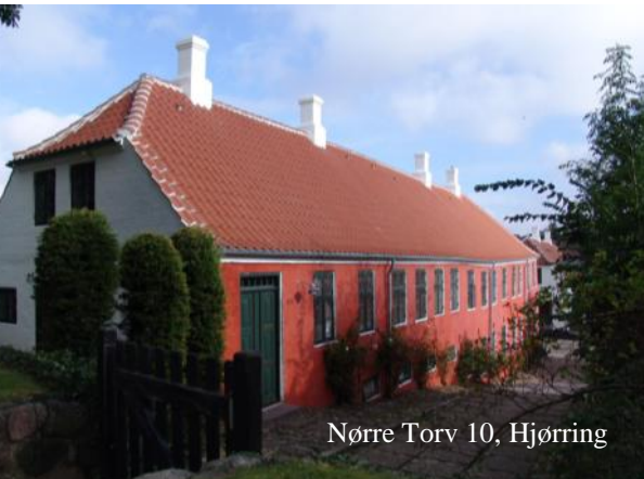
Nørre Torv 10, Hjørring