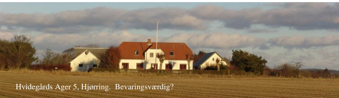
Hvidegårds Ager 5, Hjørring. Bevaringsværdig?

FBL-Hjørring vil gerne bidrage til, at udpegningen af bevaringsværdige bygninger i Hjørring Kommune bliver mere geografisk dækkende. Derfor opfordres alle til at gøre opmærksom på de gode eksempler, de kender til, ved henvendelse til formanden@fblihoerring.dk . FBL vil så bringe forslagene videre til Hjørring Kommune.