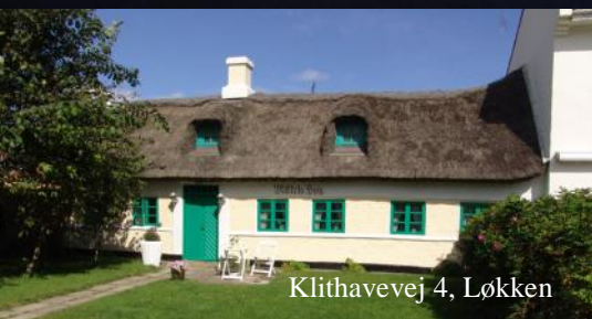
Klithavevej 4, Løkken