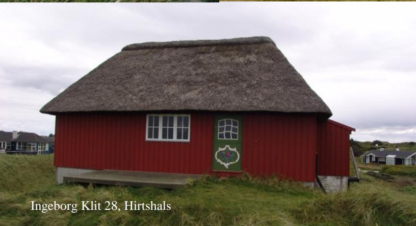
Ingeborg Klit 28, Hirtshals