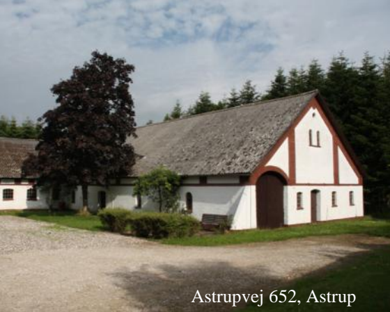
Astrupvej 652, Astrup