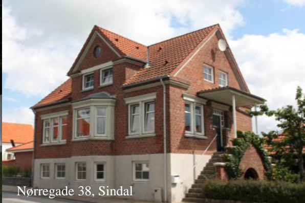
Nørregade 38, Sindal