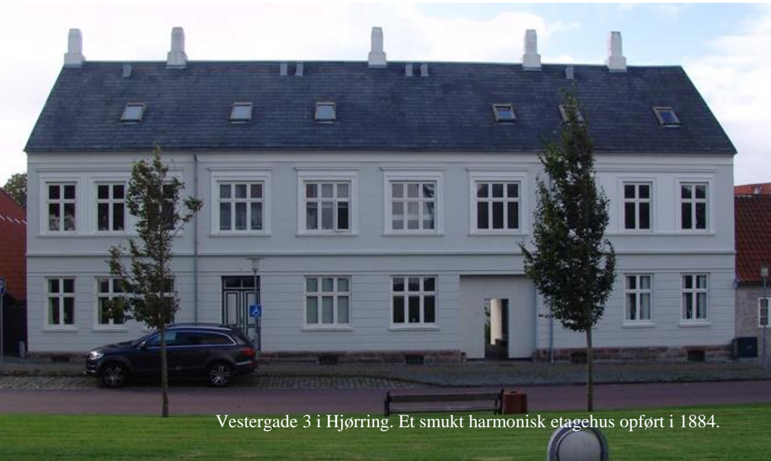
Vestergade 3 i Hjørring. Et smukt harmonisk etagehus opført i 1884.