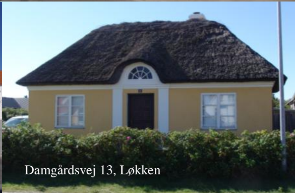
Damgårdsvej 13, Løkken