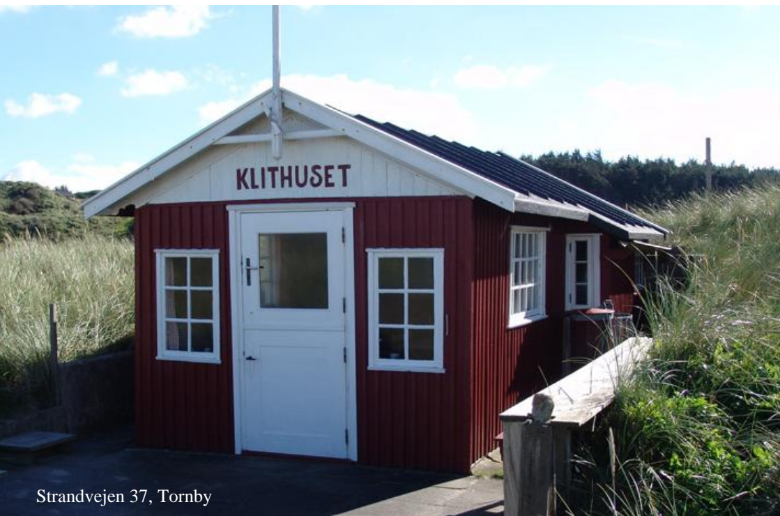
Strandvejen 37, Tornby