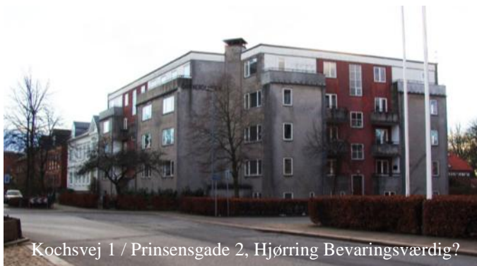
Kochsvej 1 / Prinsensgade 2, Hjørring Bevaringsværdig?

Nedrivning af en bevaringsværdig bygning, der kun er optaget i kommuneplanen, vil kræve en offentlig høring og byrådets accept.