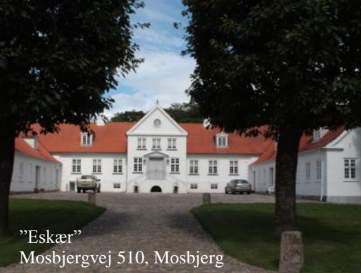
”Eskær” Mosbjergvej 510, Mosbjerg