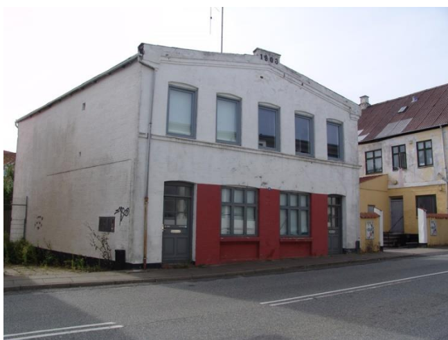
Indtil for nylig.