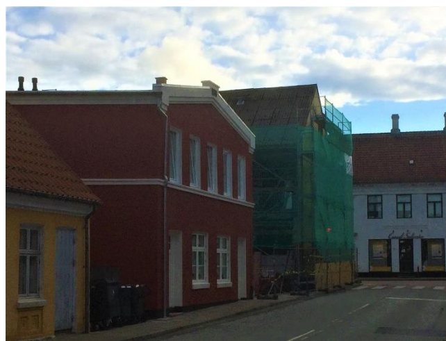
I dag. Svendehjemmet rødt. Krummes hus med stillads.

De mest iøjnespringende forhold er, at Svendehjemmet, som før stod med murstensstrukturen i den kalkede facade, nu er blevet pudset med den ændrede struktur, det giver – "intetsigende og karakterløs". Og så er de nye vinduer og døre i stueetagen i plastic – "forlorne similiprodukter". Krummes hus har fået revet bagfacaden ned; den genopbygges tilsyneladende i porebeton. Desuden isoleres huset udvendigt, så den eksisterende mur dækkes – "intetsigende og karakterløs". Siden genskabes gesimserne på facaden ved påsatte produkter – "forlorne similiprodukter". Endelig vil bagfacaden blive skæmmet af en påbygget altangang.