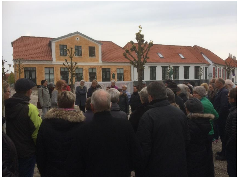
Man ser på skulpturer ved Det Gamle Rådhus og deres samspil med omgivelserne.